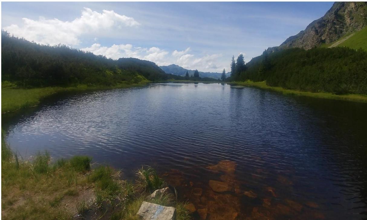
Wiegensee 1920 m, Verwall.

St. Gallenkirch ist mit öffentlichen Verkehrsmitteln erreichbar.